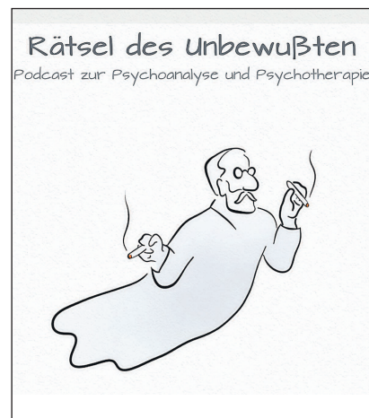
Der Podcast „Rätsel des Unbewussten“ ist eine Erfolgsgeschichte.

Erst als er über ein im Raum spürbares Gefühl der Anspannung sprach, änderte sich etwas mit der Abwehr: Der Raum wurde dafür frei, dass die Patientin über ihr Mutter-Schwesterproblem sprechen konnte. Am Ende der Stunde fiel ihr ein, dass sie im Traum eine Kühlschränktür geöffnet habe, woraufhin alles auf den Boden fiel. Der geschlossene Kühlschrank – ihr Konzept von Containing, Dinge einfrieren. ... „Wo es keine Idee einer Halt gebenden Be-