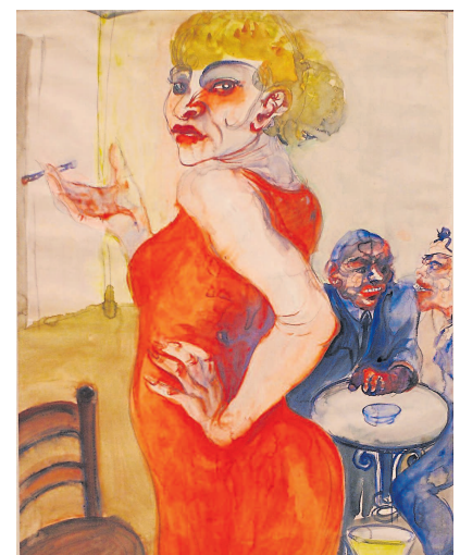
Lissy heißt dieses Bild von 1931.

„Elende Lebensumstände und eine gescheiterte Ehe führen zu psychischen Problemen und 1929 zu einem ersten Klinikaufenthalt“, so das Barlach-Haus weiter. 1940 wurde Elfriede Lohse-Wächtler im Rahmen der nationalsozialistischen Krankenkasse („Aktion T4“) umgebracht. (rd)